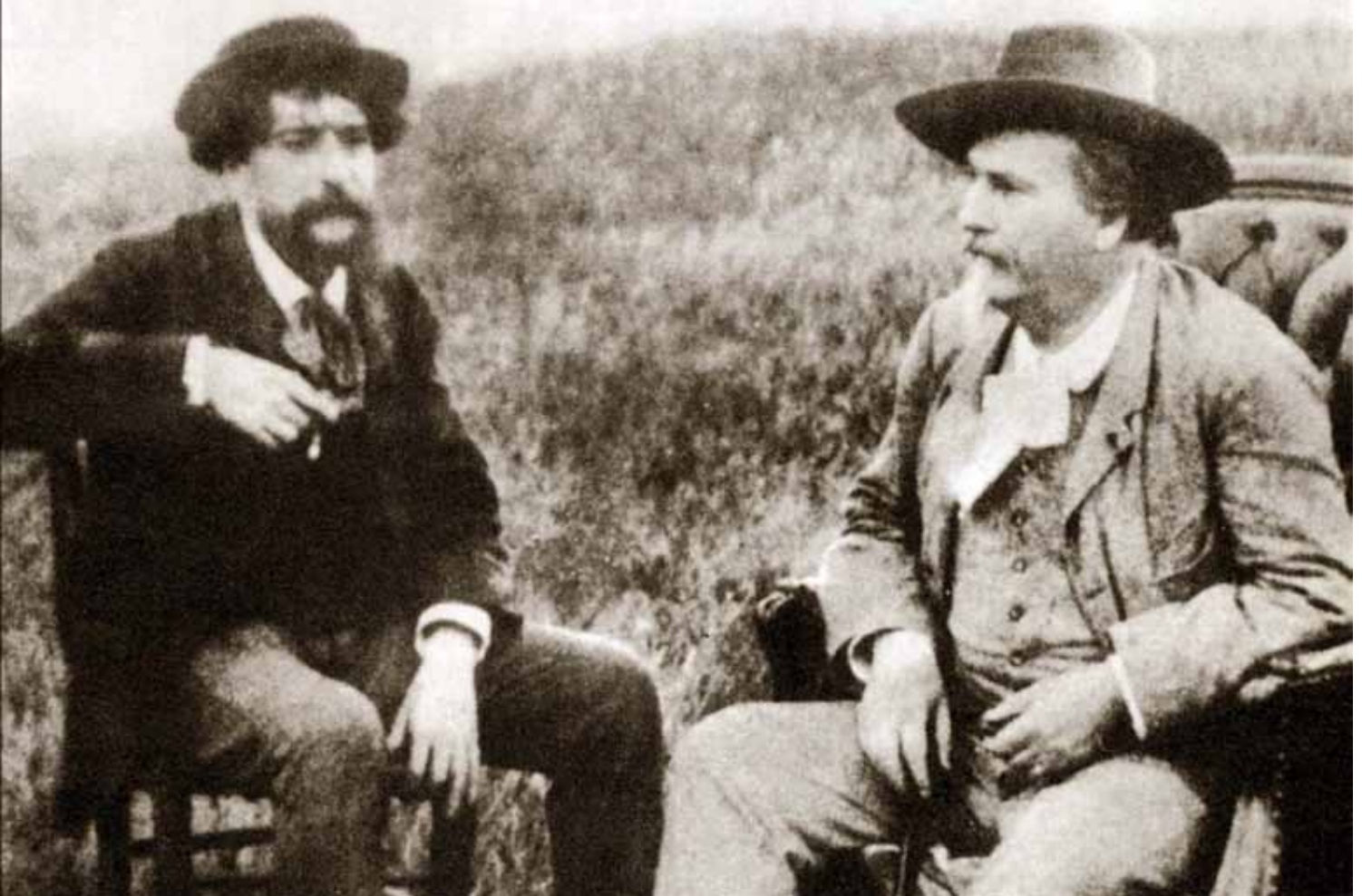
Alphonse Daudet et Frédéric Mistral en 1900

C'était là le secret de maître Cornille ! C'était ce plâtras qu'il promenait le soir par les routes, pour sauver l'honneur du moulin et faire croire qu'on y faisait de la farine... Pauvre moulin ! Pauvre Cornille ! Les ailes viraient toujours, mais la meule tournait à vide.