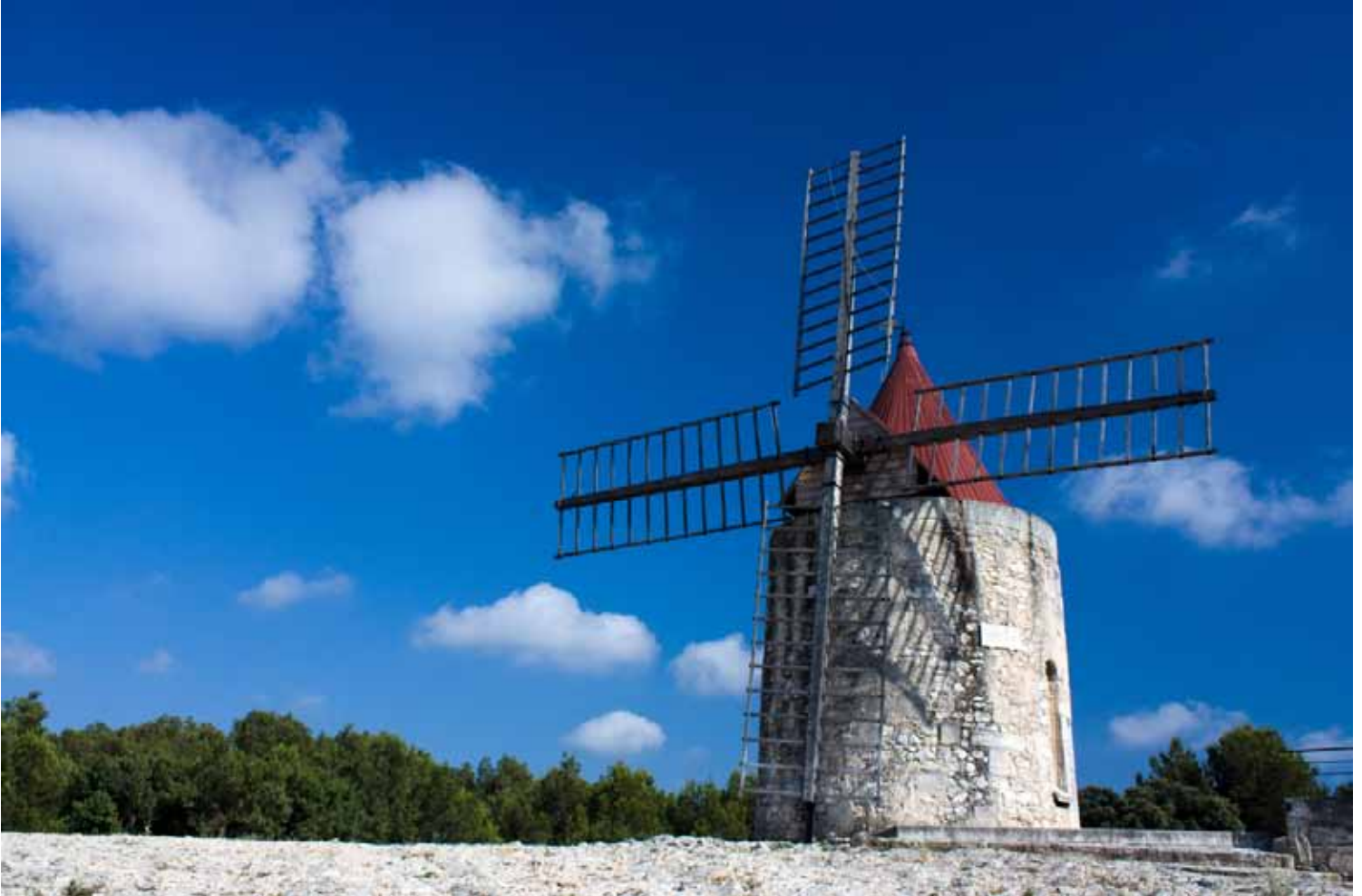
Moulins de Fontvielle, Bouches-du-Rhône

M âître Cornille était un vieux meunier, vivant depuis soixante ans dans la farine. L'installation des minoteries l'avait rendu comme fou. Pendant huit jours, on le vit courir par le village, meutant le monde autour de lui et criant de toutes ses forces qu'on voulait empoisonner la Provence avec la farine des minotiers. «N'allez pas là-bas, disait-il ; ces brigands-là, pour faire le pain, se servent de la vapeur qui est une invention du diable, tandis que moi, je travaille avec le mistral et la tramontane, qui sont la respiration du Bon Dieu...», mais personne ne l'écoutait.