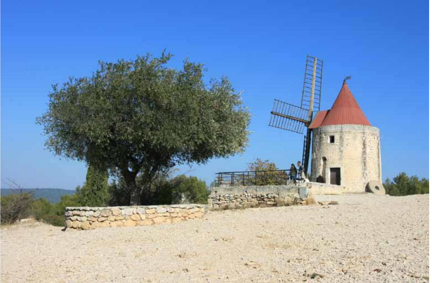
Moulins de Fontvielle, Bouches-du-Rhône